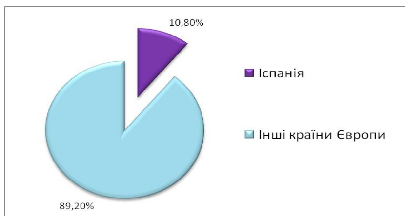
Рис. 3.3. Розподіл туристських прибуттів з-за кордону в країни Європи (побудовано за даними [51])