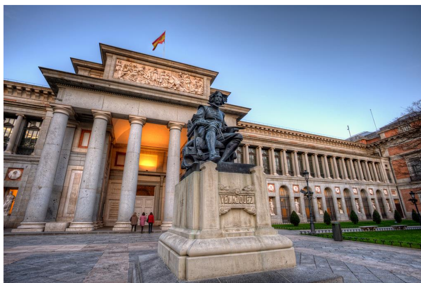
Рис. 2.11. Музей Прадо в Мадриді [54]