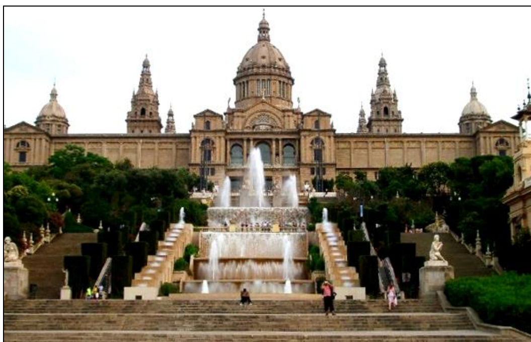
Рис. А.1. Національний музей мистецтва Каталонії в Барселоні [66]