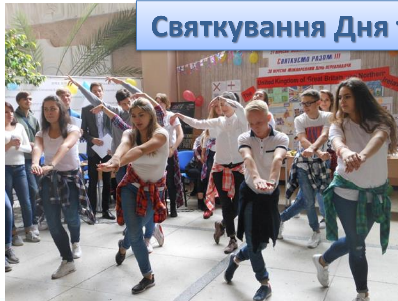
Святкування Дня туризму