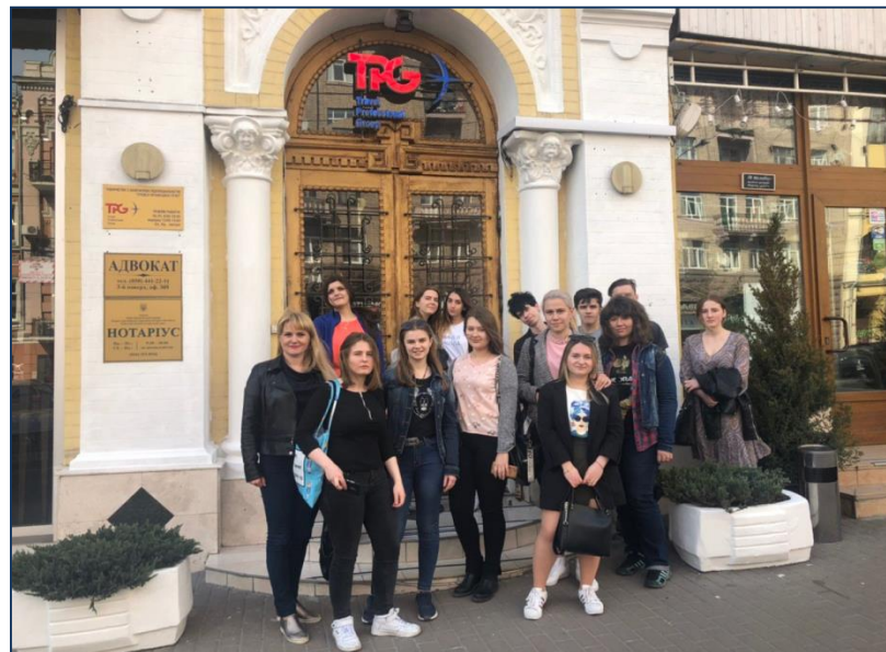
Національний туристичний оператор «Travel Professional Group»