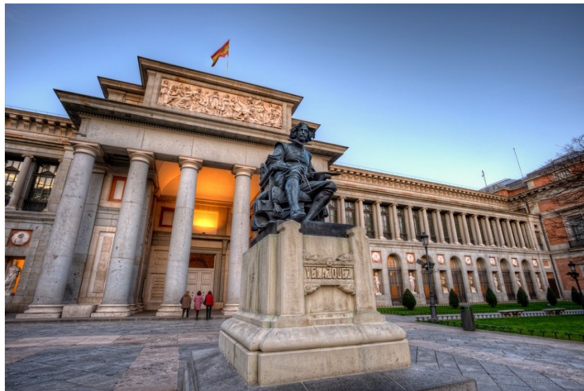
Рис. 2.11. Музей Прадо в Мадриді [54]