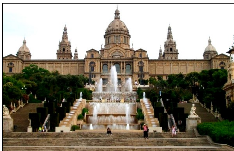
Рис. А.1. Національний музей мистецтва Каталонії в Барселоні [66]